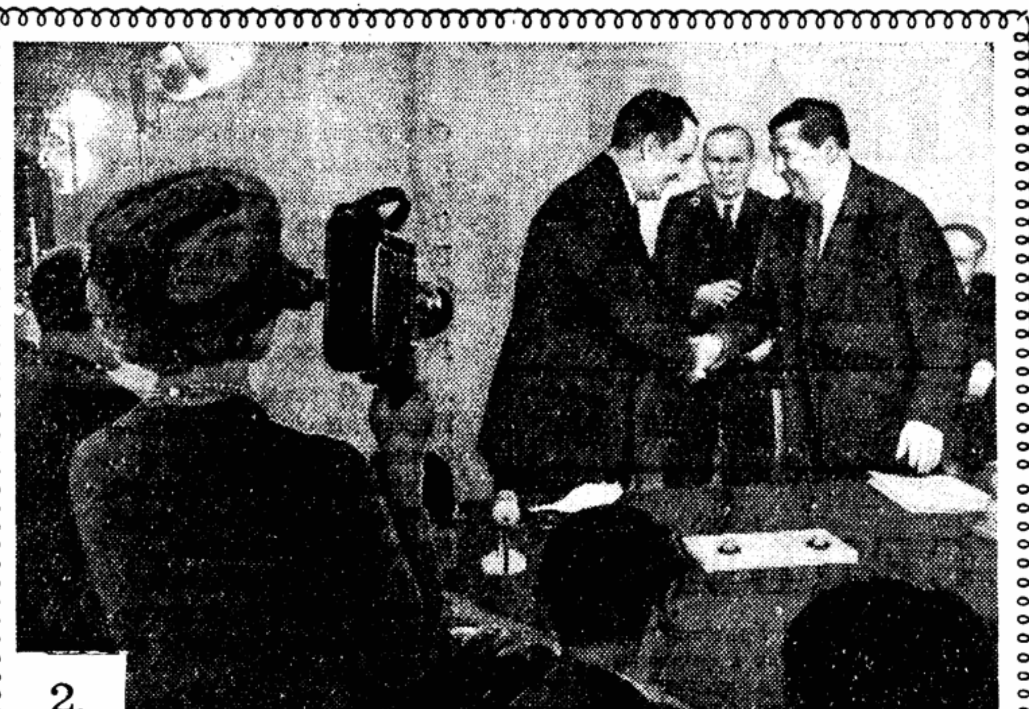
2. МОСКВА — город мира, дружбы, сотрудничества. Еще один документ подтверждает добрую славу нашей столицы — на днях подписано соглашение о научном и культурном обмене с Соединенными Штатами Америки.